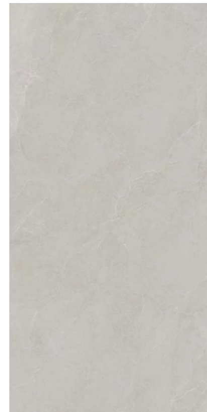
GREY 163x324_64"x127" 199097 Naturale