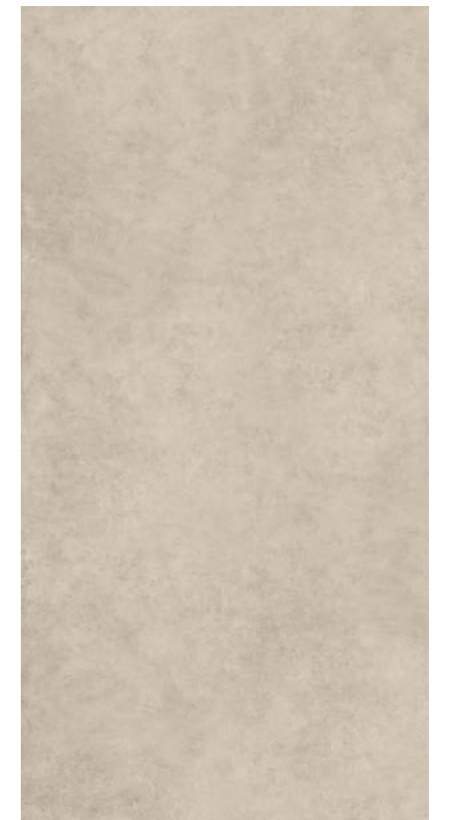
BEIGE 163x324 _64"x127" 177098 Naturale