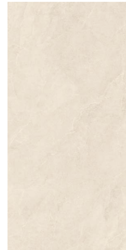
BEIGE 163x324_64"x127" 199098 Naturale