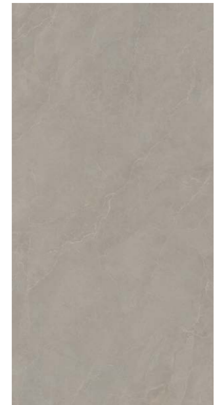
TAUPE 163x324_64"x127" 199100 Naturale