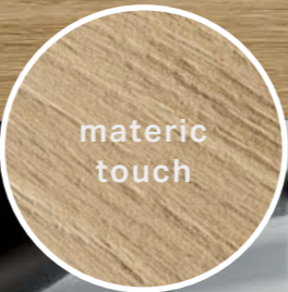
Table ROVERE 163x324_64"x127" Nat