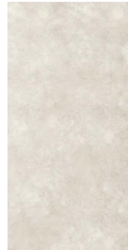
WHITE 163x324 _64"x127" 177097 Naturale