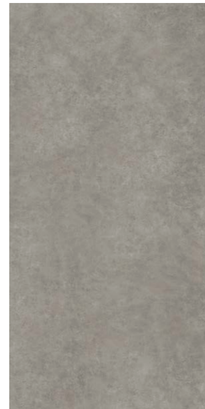
GRAY 163x324 _64"x127" 177099 Naturale